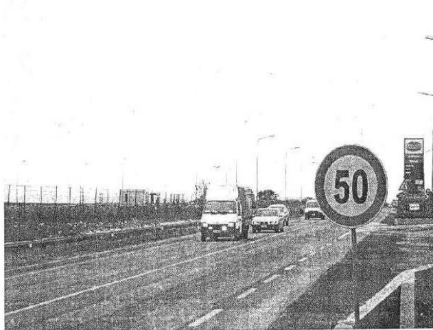
Nuovo passo in avanti per la realizzazione del raddoppio della Statale 514

«In un primo momento - afferma la senatrice - ci era stato detto che l'atteso passaggio sarebbe stato formalizzato entro il mese di settembre. Dopo